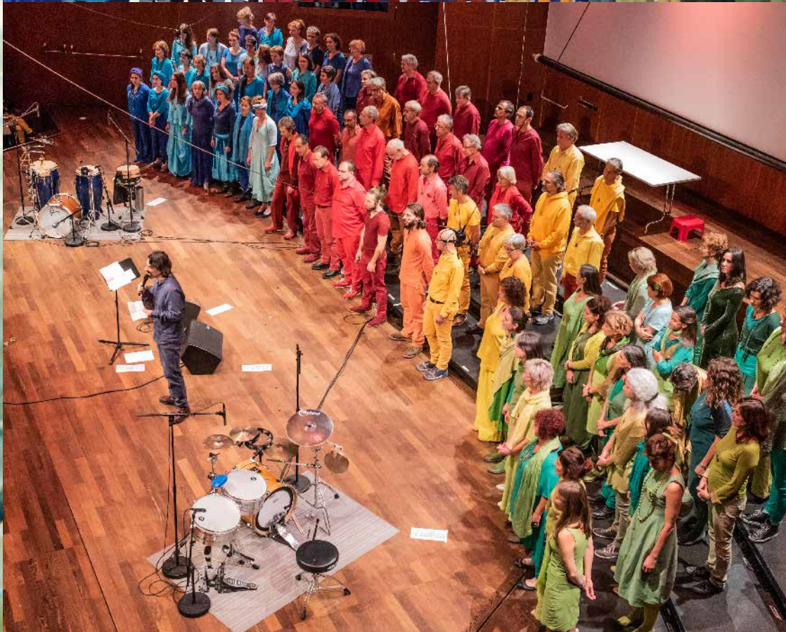
Goccia di Voci Au/ZH, Solothurn & Ticino Projekt ‚impulsi‘, RSI Studio Lugano, 2018