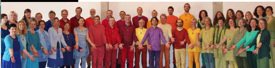
Goccia di Voci Solothurn

„Goccia di Voci Solothurn“ sind ungefähr 35 - 50 Sängerinnen und Sänger jeden Alters. Oskar Boldres Arbeit mit Chören lebt von besonderen Interpretationen: die Stimme mit ihren verschiedenen Klangfarben wird zum Musikinstrument, und Rhythmus ist von grosser Bedeutung. Die Arrangements der Lieder vermitteln Schwung, Wärme, Dynamik und Leidenschaft. Die starke Betonung der Improvisation – eine Spezialität des Chors – macht die Konzerte von „Goccia di Voci“ zu einem der interessantesten Erlebnisse in der aktuellen Chorlandschaft. Die Auftritte werden überall sowohl für ihre Lebendigkeit wie auch für die Energie geschätzt, welche die Lieder freisetzen.